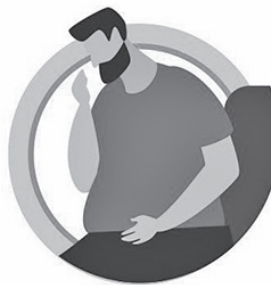
У ЛИЦ, ИМЕЮЩИХ ХРОНИЧЕСКИЕ ЗАБОЛЕВАНИЯ