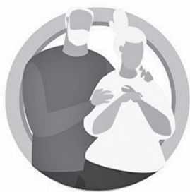
У ПОЖИЛЫХ ЛЮДЕЙ СТАРШЕ 65 ЛЕТ

РИСК ТЯЖЕЛОГО ТЕЧЕНИЯ ГРИППА И ОРВИ ЗНАЧИТЕЛЬНО ВЫШЕ: