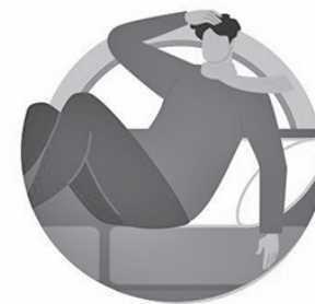
У ЛИЦ С ОСЛАБЛЕННОЙ ИММУННОЙ СИСТЕМОЙ