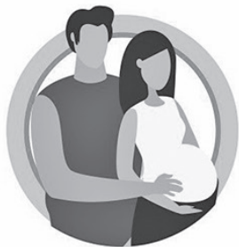
У БЕРЕМЕННЫХ ЖЕНЩИН