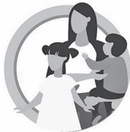
У ДЕТЕЙ ДО 5 ЛЕТ