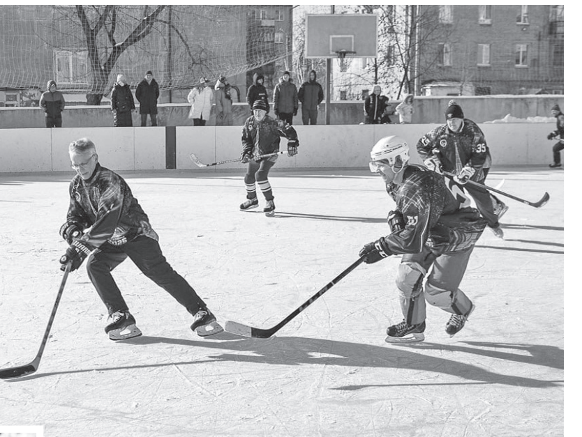
На льду стадиона «Пионер» двукратный олимпийский чемпион Игорь Ларионов

Не забыл юбиляр и о спортивных героях Дзержинска,