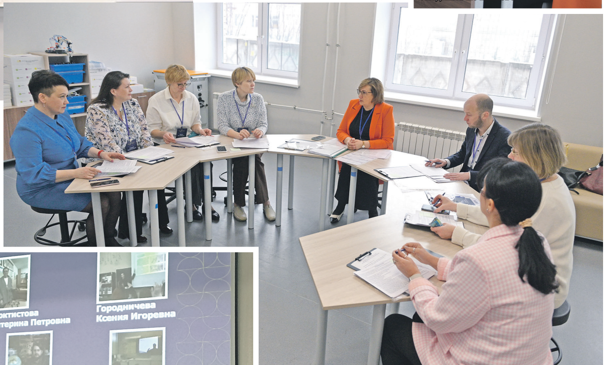
Жюри за работой

в нашей повседневной жизни, просто мы не всегда это замечаем. Эти два участника были признаны лучшими в номинациях «Применение инновационных технологий» и «Творческий поиск и оригинальность решений».