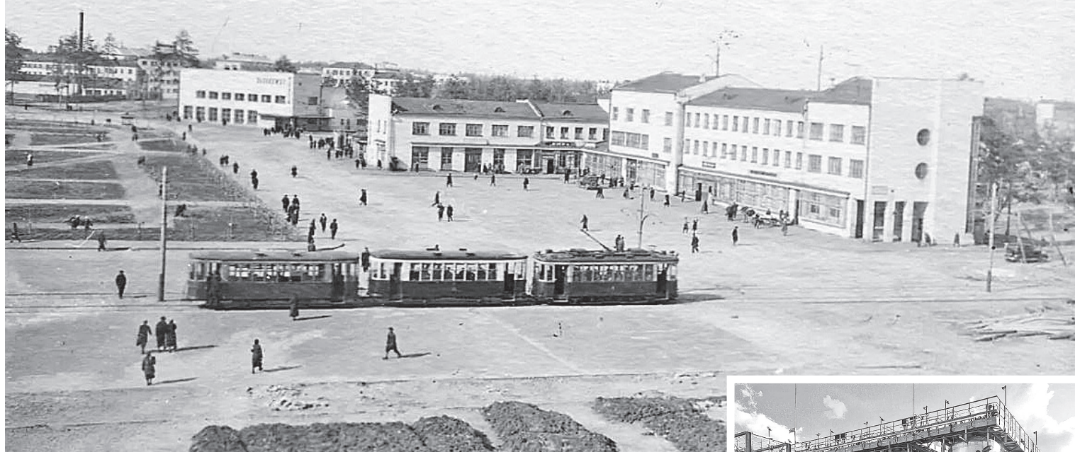
Площадь Дзержинского, 30-е годы

округе паровую мельницу и дачу – чудесный теремок в древнерусском стиле. На бугровской даче бывали сам Горький, министр финансов России Сергей Витте и другие важные персоны, которых знала вся страна.