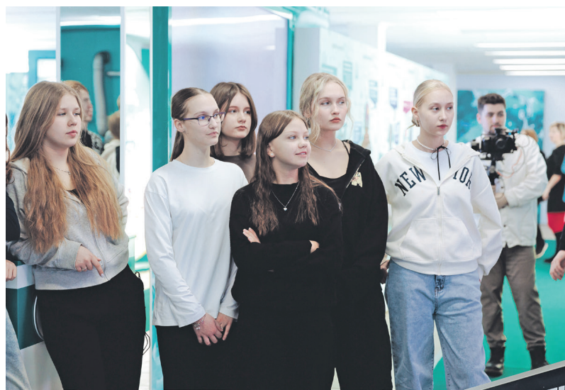
Будущие химики, для которых организована выставка

были гидами в «Доме полимеров» в период его работы на выставке-форуме «Россия» в Москве.