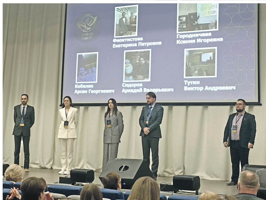
За победу боролись пять финалистов

«Не воспитывайте детей, они всё равно будут похожи на вас. Воспитывайте себя!»