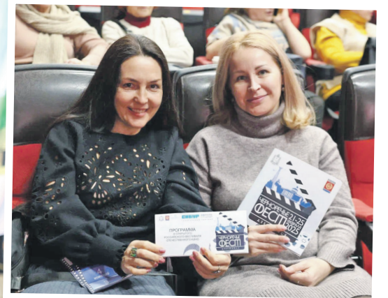
На конкурсном кинопоказе