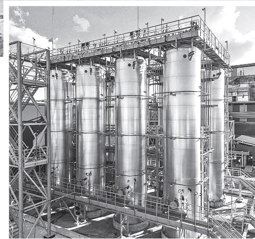
Производство мономинна в ОЭЗ «Кулибин»