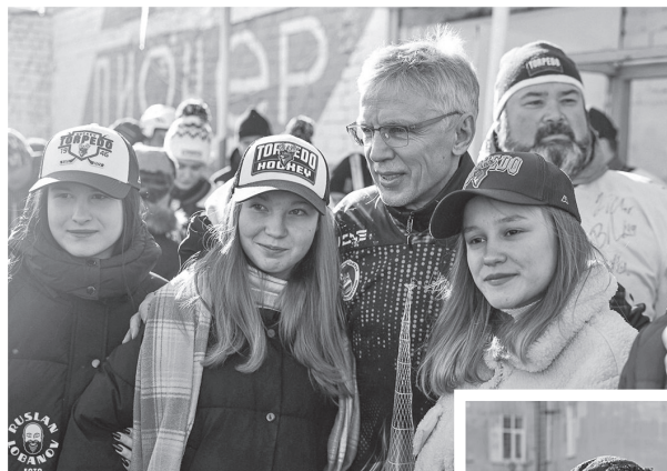
Игорь Ларионов и игроки женской команды «Торпедо»