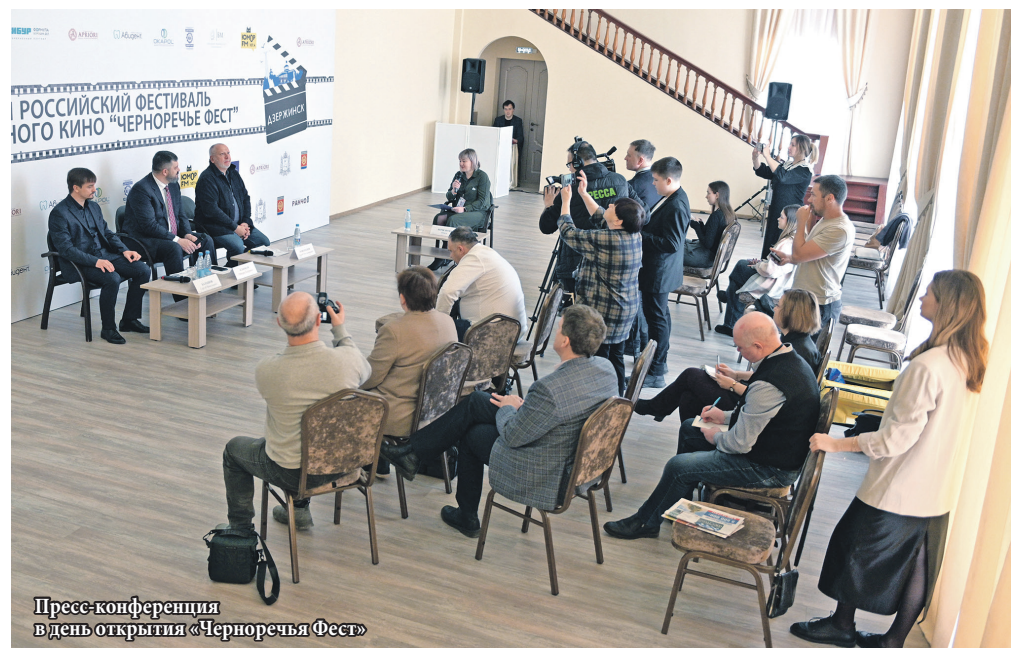
Пресс-конференция в день открытия «Черноречья Фест»