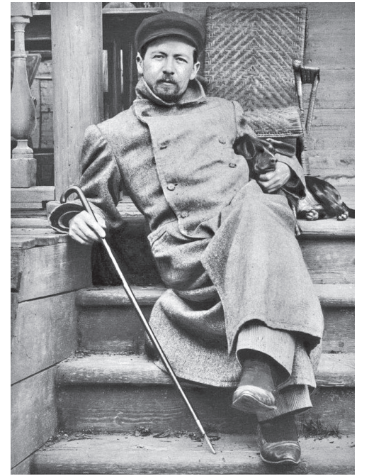
Чехов на крыльце дома в Мелихове с таксой Хинной

Чехов несколько раз бывал в Нижнем Новгороде. И в январе 1892 года Антон Павлович пробыл в Нижегородской губернии целую неделю. Писатель останавли-