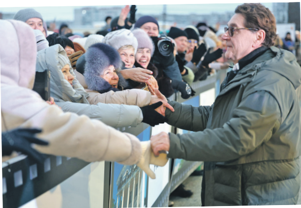
Сергей Маковецкий популярен среди зрителей

Уже в третий раз Дзержинск принимает артистов эстрады, актеров кино и служителей Мельпомены. В третий раз горожане, в большинстве своем, ассоциируют февральские праздники именно с кинофестивалем. В третий раз профессионалы и любители киноиндустрии приезжают в наш город, чтобы выбрать лучшие работы сезона и вручить победителям мини-копии Шуховской башни – незыблемого символа фестиваля отечественного кино «Черноречье Фест», зародившегося и прочно обосновавшегося в нашем провинциальном городке.