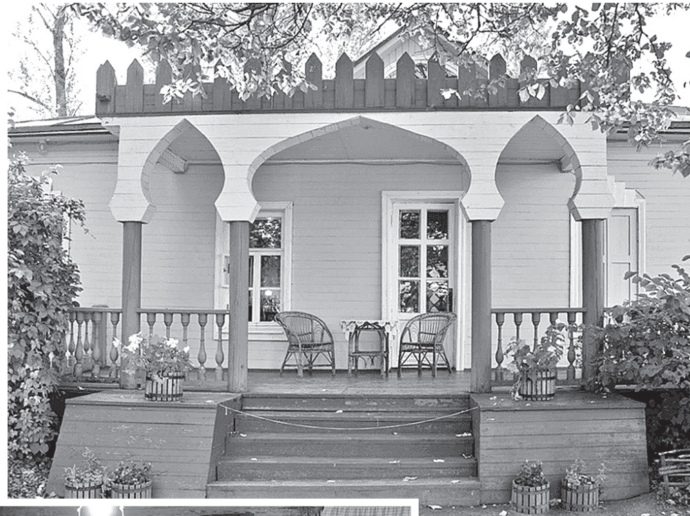
Усадебный дом в Мелихове

В наступившем году исполнилось 165 лет со дня рождения Антона Павловича Чехова. За эти годы в жизни и искусстве произошло много сложных и противоречивых событий. Но произведения, созданные известным писателем, не только не устарели, но стали еще более актуальными. Его повести и рассказы переведены на десятки языков и опубликованы во многих странах мира, а пьесы с огромным успехом идут в самых лучших театрах. В чем же загадка его творчества? Однозначно ответить на этот вопрос невозможно. Мне кажется, чтобы понять Чехова, очень важно своими глазами увидеть места, где он жил и работал.