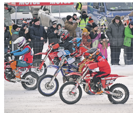
Юные гонщики СШОР «Салют» проявили себя с самой лучшей стороны, завоевав шесть медалей