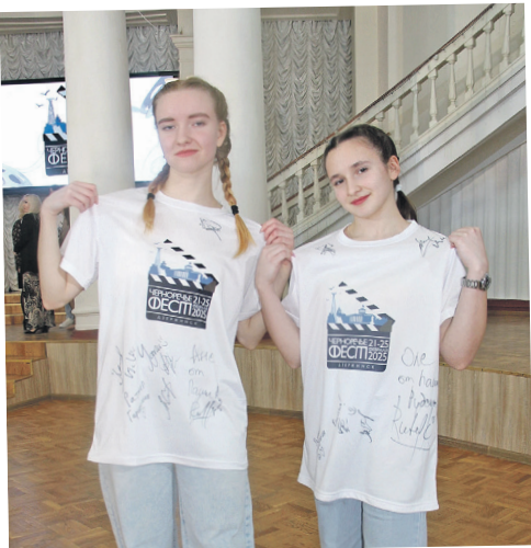
Автографы на память от актеров