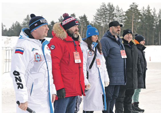
Почетные гости соревнований