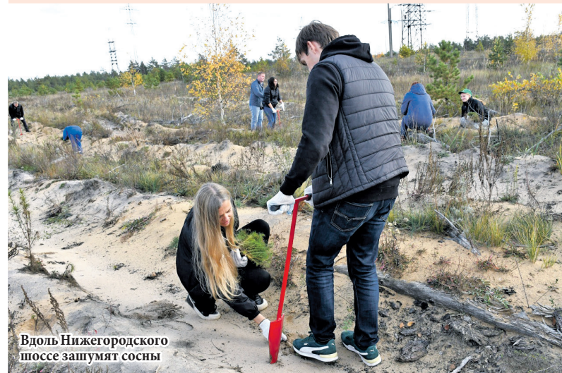
Вдоль Нижегородского шоссе зашумят сосны