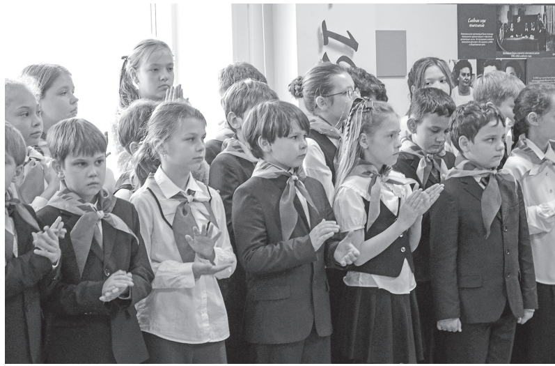
Юные патриоты учатся на героических примерах