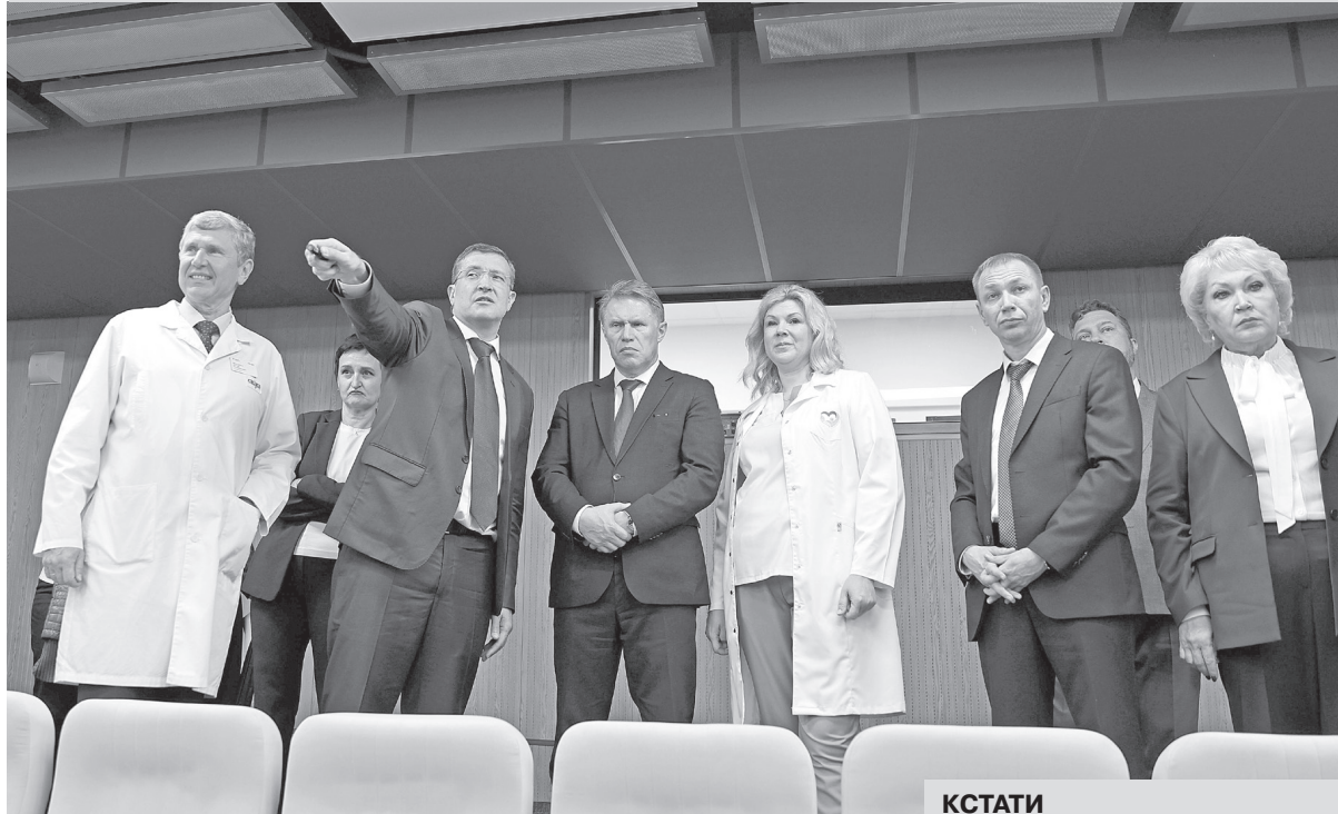
Михаил Мурашко и Глеб Никитин в Нижегородском кардиоцентре

Делегация федерального Минздрава посетила еще один полностью отремонтированный лечебный корпус, где установлен аппарат МРТ, а также открыты малый и большой конференц-залы. Теперь в них проводятся образовательные мероприятия для сотрудников нижегородских больниц и студентов-медиков.