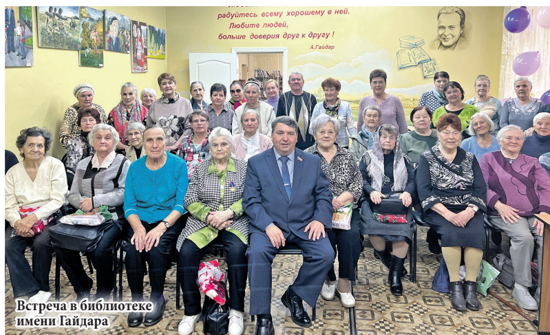
Встреча в библиотеке имени Гайдара

Благоустройство, поддержка старшего поколения, помощь социальным учреждениям – депутаты городской Думы в своих округах ведут активную работу.