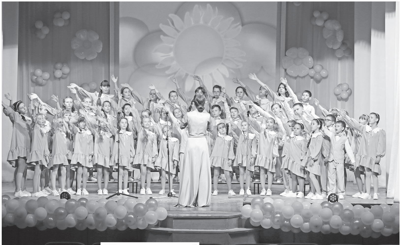
К отчетным концертам хоровой коллектив «Тоника» всегда готовит яркие выступления

Понятно, что до выпускного дойдут не все, и процент отсева большой. Из хора ребята уходят по разным причинам: кто-то,