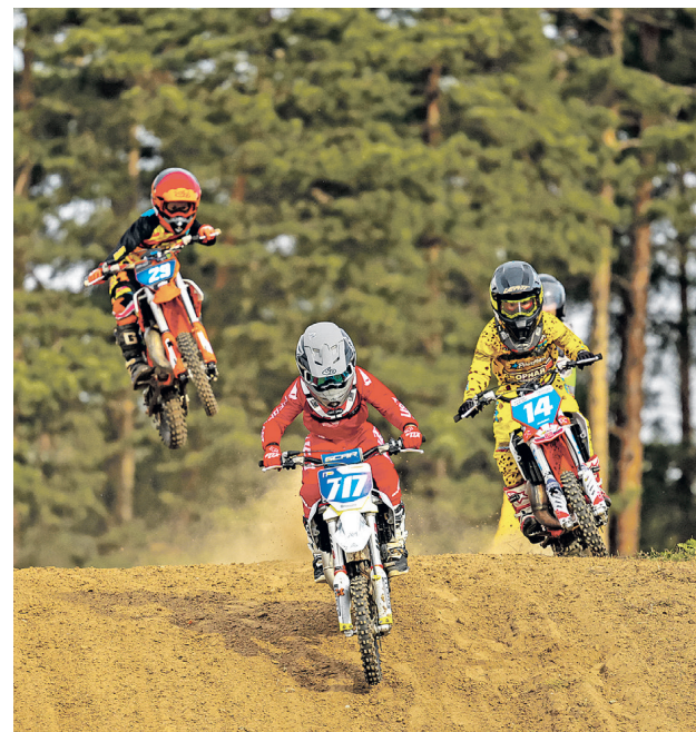
В упорной борьбе на трассе