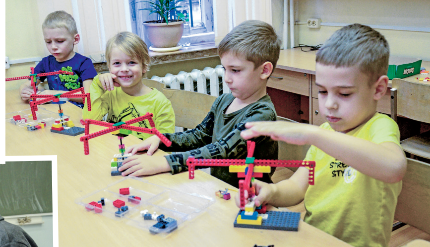
Во время занятий на Станции юных техников