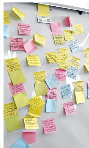
На доске объявлений можно найти нужные контакты