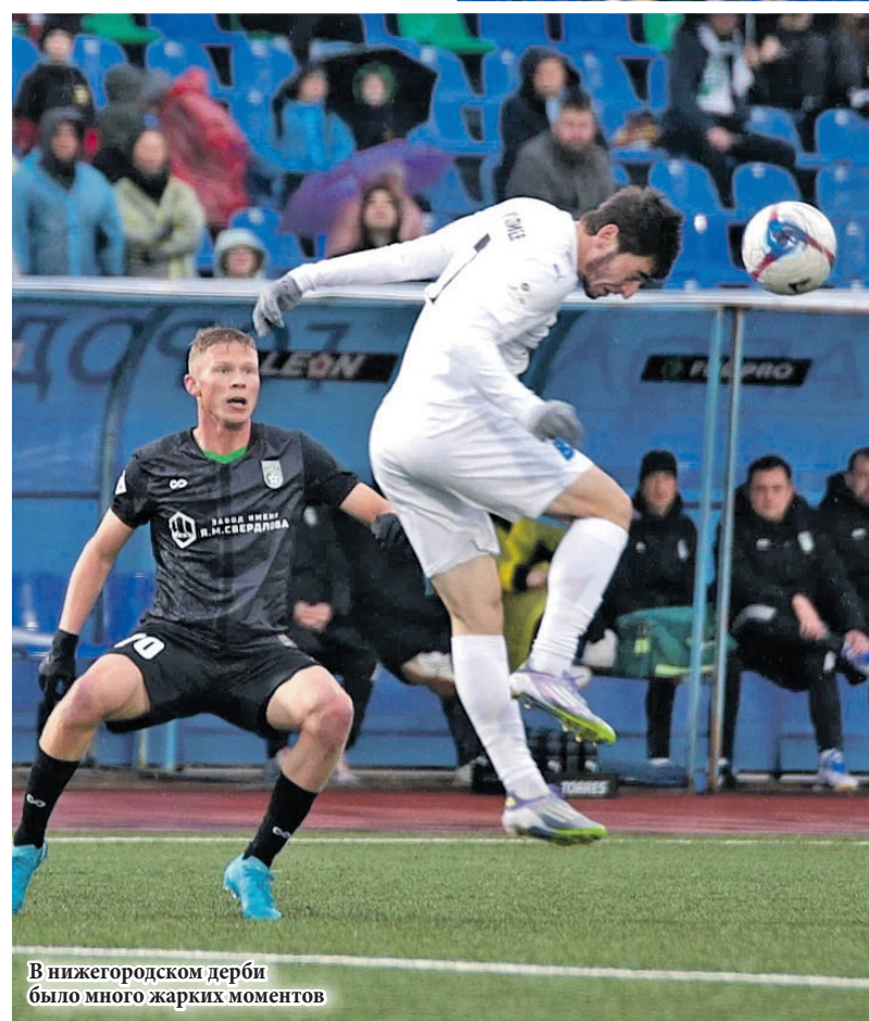
В нижегородском дерби было много жарких моментов

Всё решится 19 октября в поединке между командами «Амкар-Пермь» и «Динамо-Барнаул». Чтобы опередить дзержинцев и самим подняться в более высокий футбольный дивизион, пермякам нужна только победа.