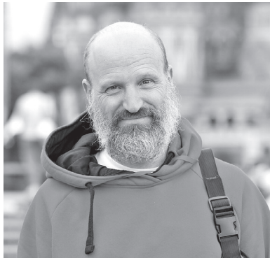
Дмитрий Емец приехал в Нижний

С ней сравнивает художественное произведение (где изюм – чистая правда, а тесто – вымысел) популярный писатель-фантаст, автор серий книг про Таню Гроттер, Мефодия Буслаева, Школу Ныряльщиков и других персонажей Дмитрий Емец. На встрече с читателями он рассказал о своем творчестве, первых шагах для начинающего литератора и ответил на многочисленные вопросы. В Нижнем Новгороде прошла первая книжная ярмарка.