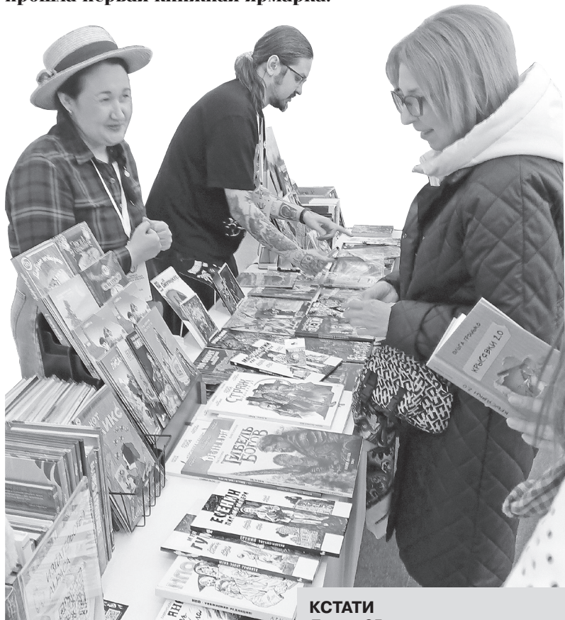
Книги на любой вкус

Встреча с миром удивительных открытий, прятанных за яркими книжными переплетами под сказочными сводами Главного ярмарочного дома, позволила посетителям не только познакомиться с новинками художественной, образовательной, детской и научно-популярной литературы. Она включала более полсотни встреч, интерактивов, лекций, мастер-классов, презентаций книг с участием известных писателей, поэтов и деятелей культуры. И это «пиршество» книжных гурманов проходило на протяжении всех трех дней, с 10 по 12 октября на Нижегородской ярмарке.