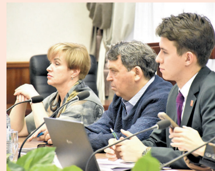
На встрече с молодыми активистами