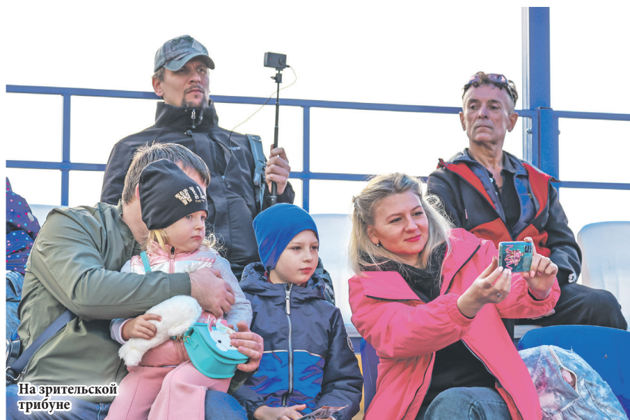
На зрительской трибуне

Юрий ПРЫГУНОВ. Фото автора и Руслана Лобанова