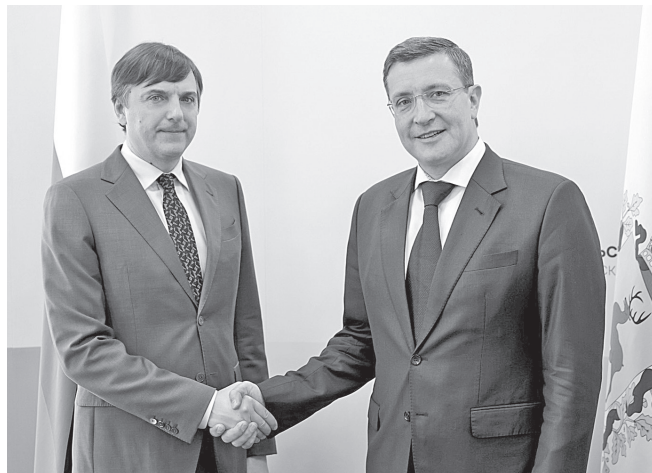
Сергей Кравцов и Глеб Никитин

организаций в рамках федерального проекта «Всё лучшее детям» для преподавания таких предметов, как «Труд (Технология)» и «Основы безопасности и защиты Родины».