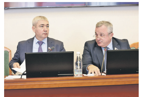
В центре внимания - поддержка АПК

Особое внимание уделяется заготовке кормов для обеспечения