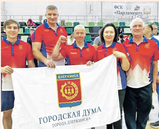
Сборная Дзержинска - в лидерах