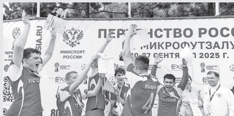
«Виктория» - чемпион России