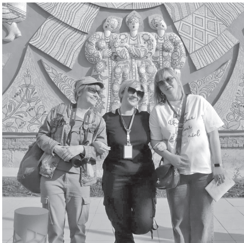
Здесь родился замысел конкурсной газеты

– То, что наша идея про купчиху изначально оказалась верной, мы поняли, когда получили список заданий. И немного перестроили концепцию. Если