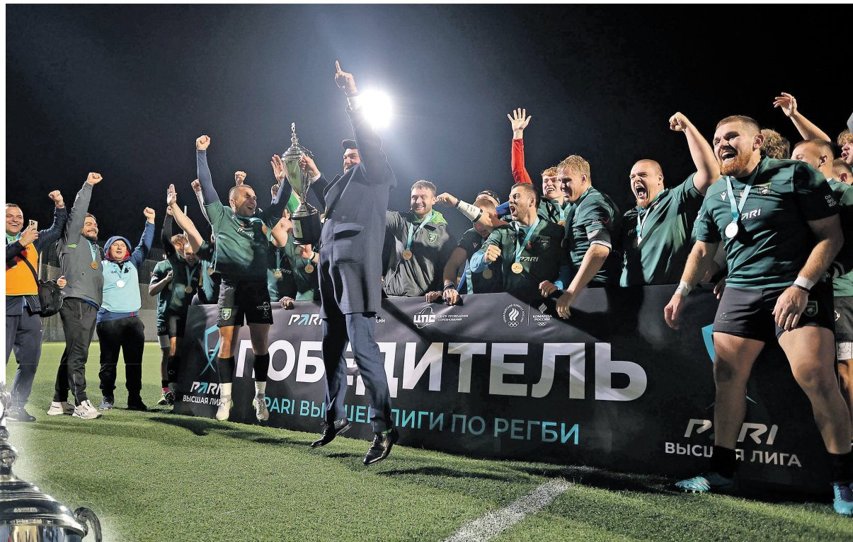
Счастливые мгновения победы

лов на искусственном поле калининградского стадиона имени Юрия Шуляковского вели отчаянную борьбу за главный трофей нынешнего сезона. Решающий матч турнира оказался вязким и не слишком результативным.