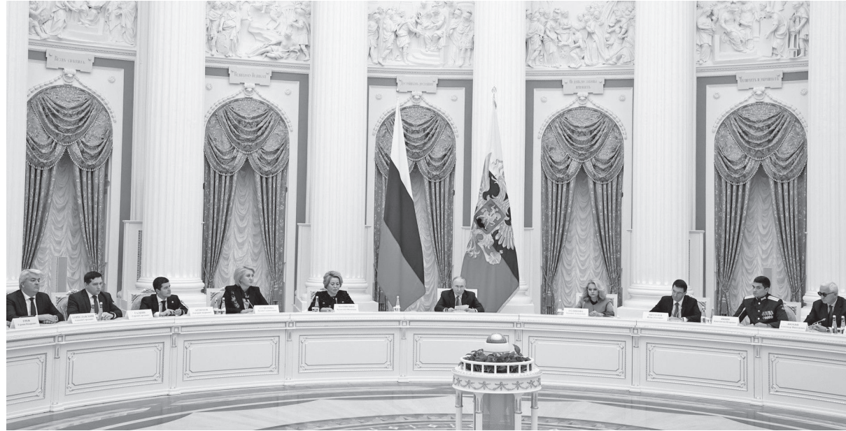
На заседании Совета при президенте РФ по реализации государственной демографической и семейной политики

Демографические инициативы Нижегородской области «отдадут» в регионы