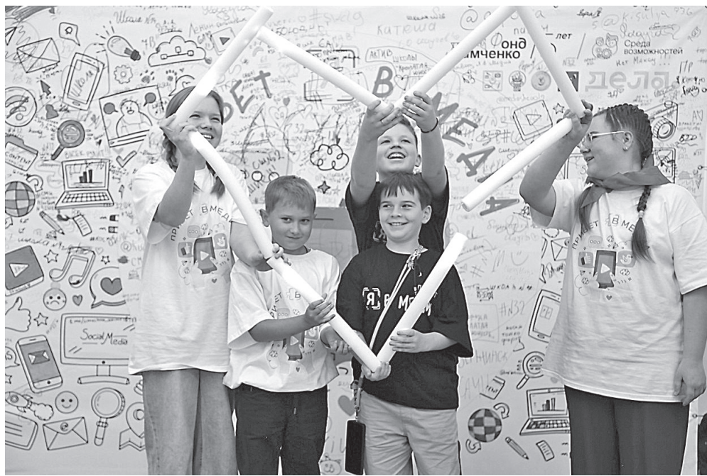
Флешмоб со светящимся сердцем

Слёт юных корреспондентов стал площадкой для обмена опытом и знаний от профессионалов медиаиндустрии. Мастер-классы, проведенные ведущими