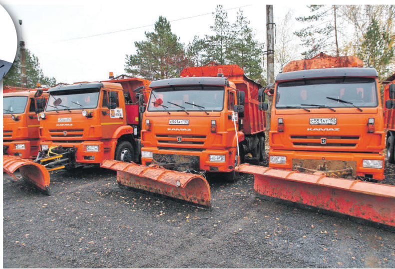
Уборочная техника в Дзержинске готова к зиме

С этого же времени подрядные организации перешли на круглосуточный режим работы.