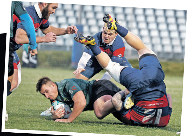
«Химик» был неуступчив

сим Максименко совершил занос практически по центру. К такому прорыву ЦСКА не был готов. Оставшись в конце матча в меньшинстве, подопечные Степана Ефремова позволили сопернику лишь сократить отставание в счете. Наблюдавший и руководивший с трибуны наставник «Химика» отметил после игры, что даже при таком напоре наши игроки уже не отдадут свое и добьются положительного результата. Действительно, отыгаться московской команде в этот октябрьский вечер было не суждено.