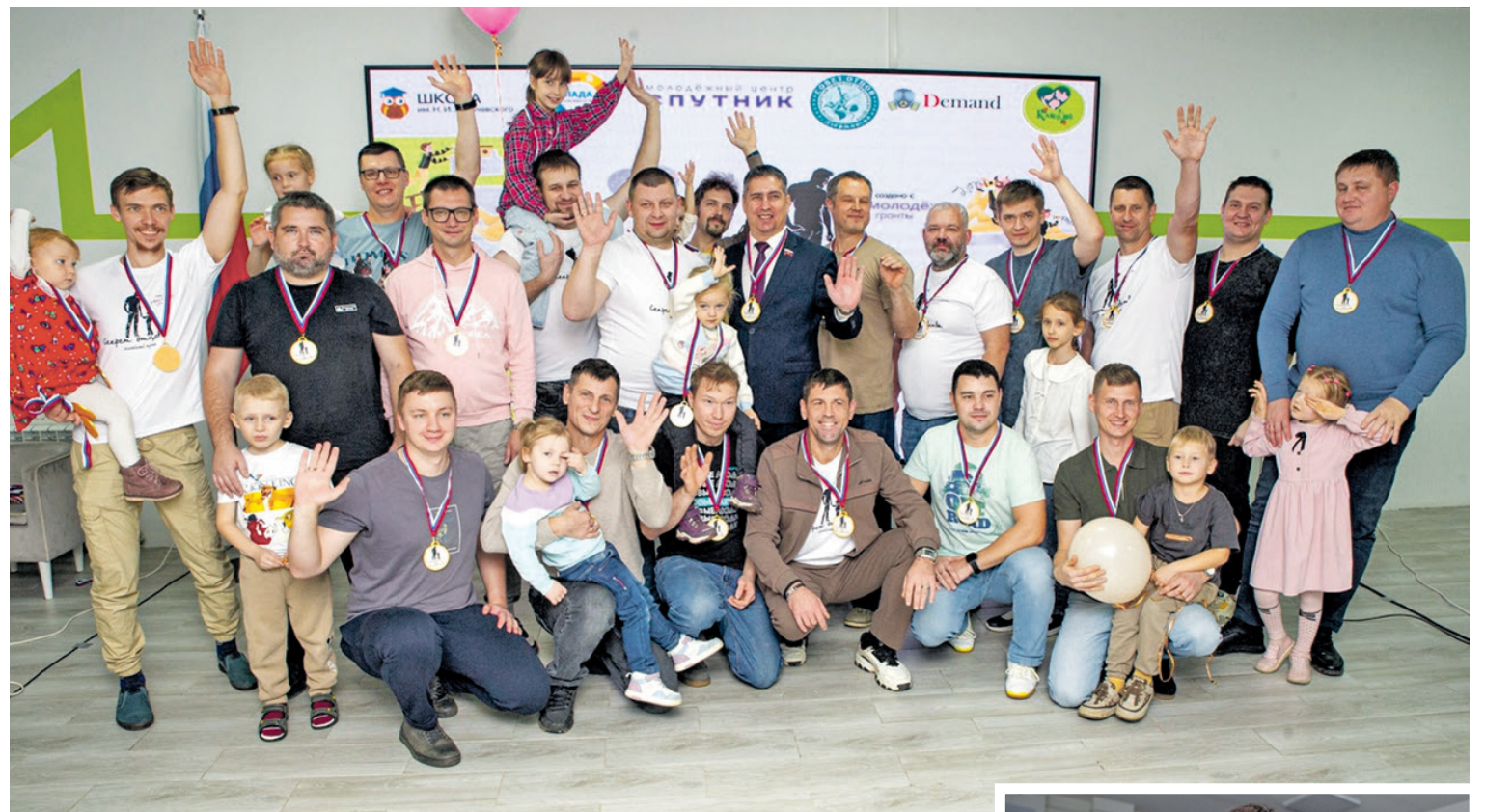
Все участники получили заряд положительных эмоций