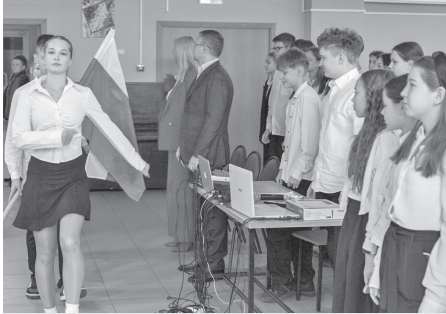
В школе № 22

Напомним, «Парта Героя» – ученическая парта с размещенной на ней информацией о заслуженном человеке, герое, имеющем непосредственное отношение к школе и вошедшем в историю Отечества, его фотографией, биографией и рассказом о героическом пути.