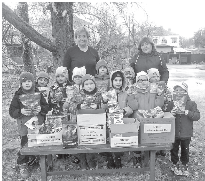
Детский сад № 102 присоединился к благотворительной акции

Не менее значимо развитие гражданской активности. Ребята видят, что их совместные усилия приносят реальные результаты. Они понимают, что могут влиять на мир вокруг себя и делать его лучше.