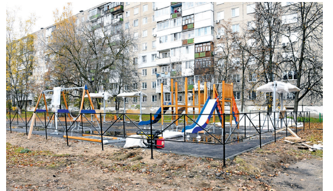
Новая детская площадка на проспекте Циолковского