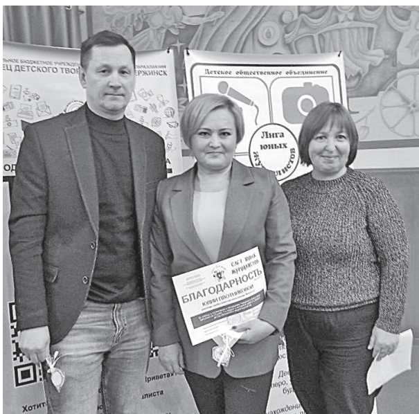
Наставники юных корреспондентов

журналистами города, вызвали живой интерес у начинающих юнкоров.