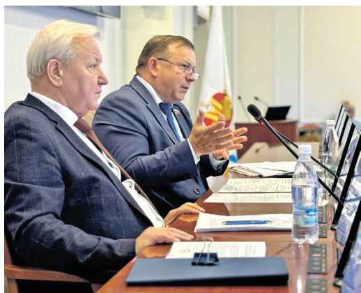
Депутаты за создание здоровой среды