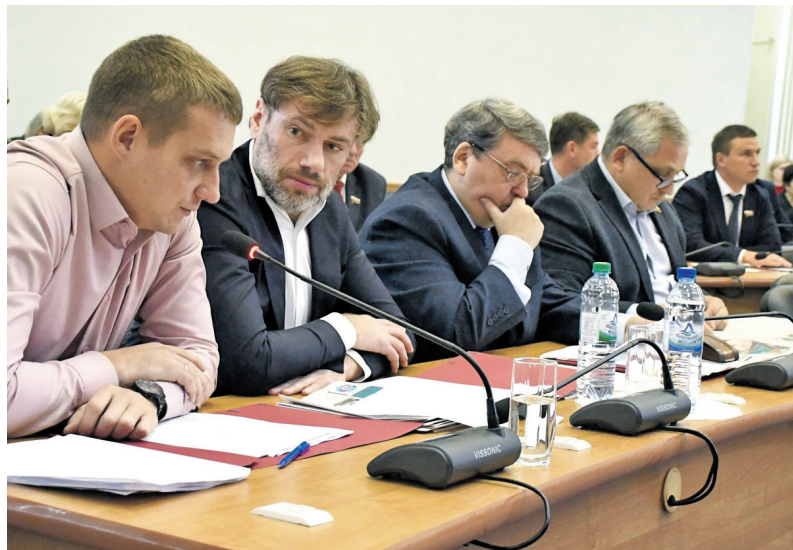
На повестке дня - важные вопросы

– Инициативная группа провела подомовой обход и собрала голоса жителей. Большинство высказалось за статус сельского поселения. Выгода есть. Во-первых, сельская ипотека, во-вторых – сниже-