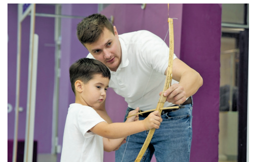
Папа научит стрелять из лука...