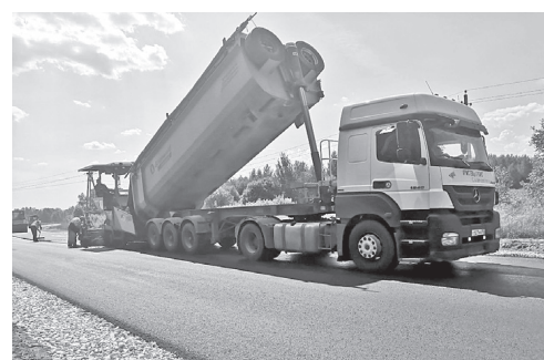
Все дороги важны

В регионе уже заключены государственные контракты на ремонт около 130 участков автомобильных дорог и мостов. Их общая протяженность 600 километров, а общая стоимость госконтрактов – 16,2 миллиарда рублей.