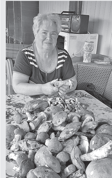
Летом в родной деревне

– На уроках вы обсуждали с учениками жизненные темы, не касаясь школьной программы?