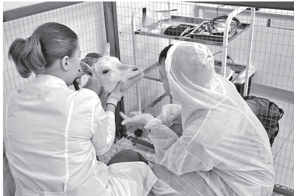
Молодых специалистов ждут на селе

Какую поддержку от государства могут получить молодые аграрии и педагоги