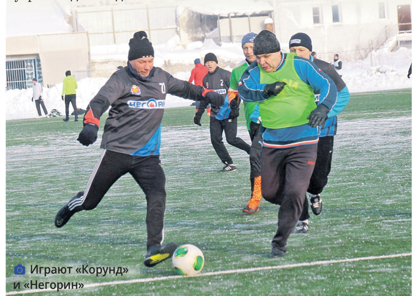
Играют «Корунд» и «Негорин»

В субботу, 31 января, на искусственном поле стадиона «Химик» состоится шесть матчей 11-го тура. Начало игр с 9 часов утра. Вход свободный.