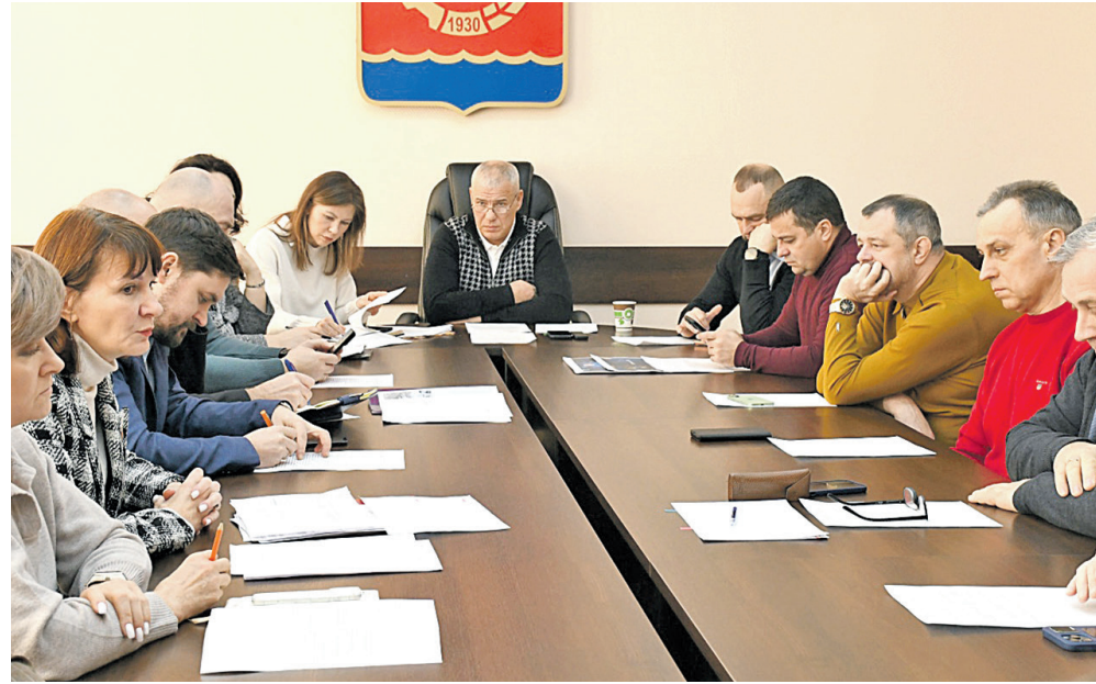
На заседании комитета решались важные вопросы

О судьбе бывшего кинотеатра, новой дороге и парковке у «Города наук»