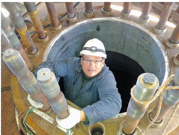
Коррозионное обследование оборудования во время одной из командировок

Нина ШУМИЛОВА