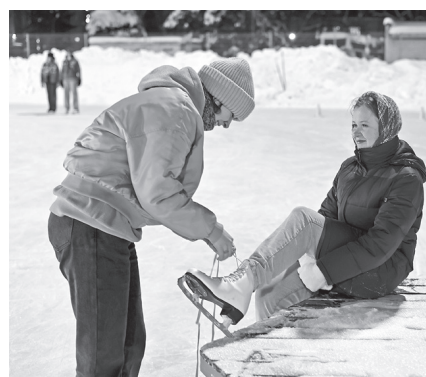
Студенческое братство на льду

в нем студентам из других городов. Сначала 19 января прошел онлайн-флешмоб «Один день из жизни студента (студень)», в котором учебные заведения публиковали короткие видеоролики о своей повседневной жизни. Лучшей работой экспертная комиссия признала