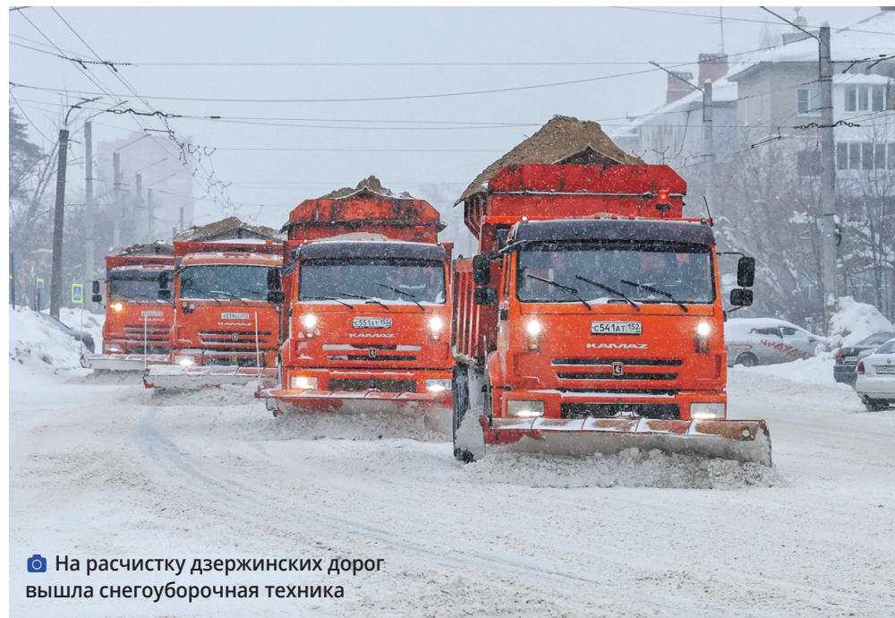
На расчистку дзержинских дорог вышла снегоуборочная техника

Это относится и к ремонту жилья для детей-сирот, пока заявлен один объект.