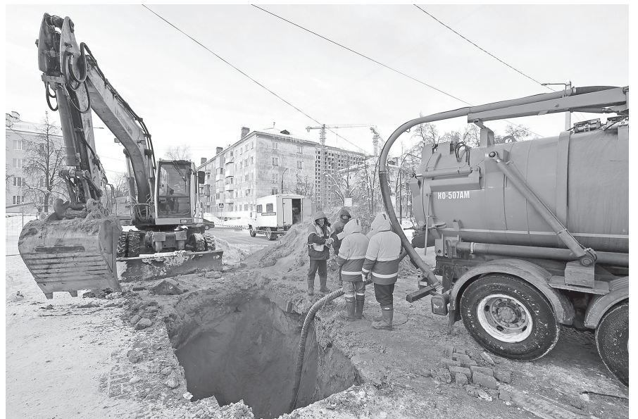
Коммунальные бригады работали до полного устранения аварии

– Произошедшие аварии – это результат сочетания нескольких факторов, таких, как низкие температуры и подвижка грунта. Все