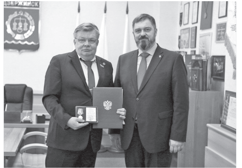
На вручении медали