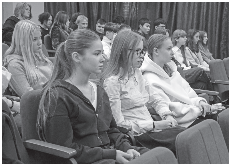
Школьники задумчиво слушают историю героев города на Неве

В этом году одними из первых гостей Дома книги стали учащиеся 9 «В» класса 12-й школы. Поначалу оживленно переговаривавшиеся, они уважительно стихли, увидев на экране тему лекции – «Символы блокадного Ленинграда».