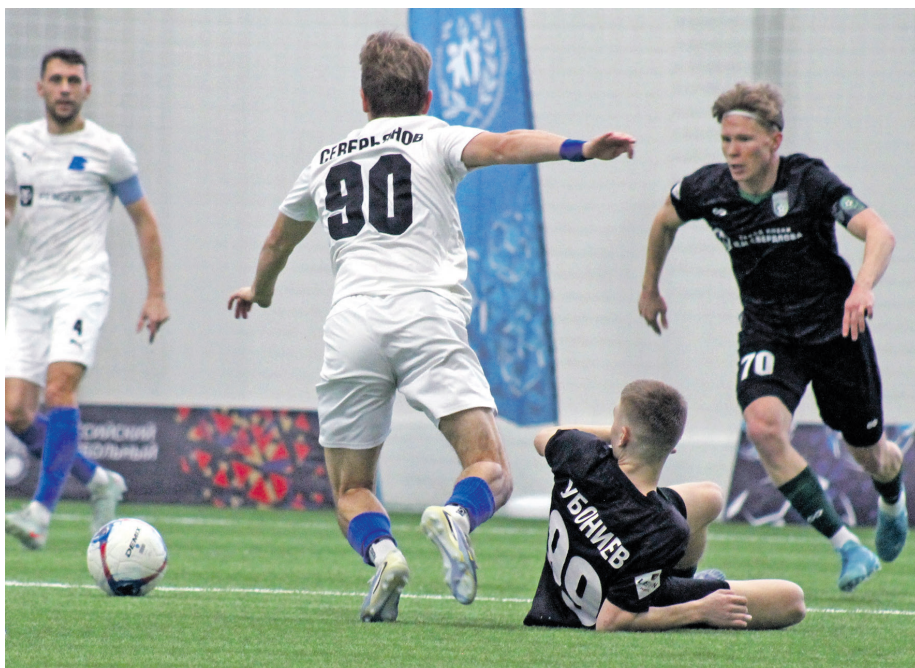
Финальный матч выдался упорным

Борьба за второй по счету кубковый трофей, учрежденный региональной федерацией