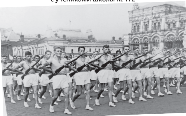
Парад физкультурников, 1938 г.