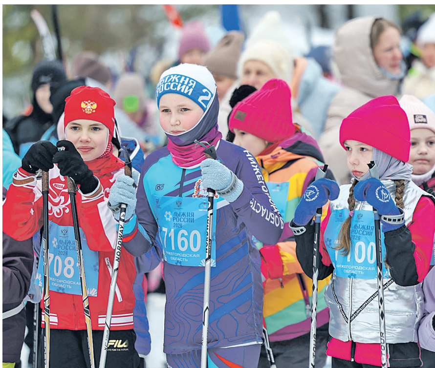
Внимание: на старт!

Уже в девятнадцатый раз Дзержинск принял участие во Всероссийских соревнованиях «Лыжня России», ставших неотъемлемой частью спортивного календаря жителей нашей страны. На трассу лыжно-биатлонного стадиона «Магнитная стрелка» 14 февраля вышло более тысячи жителей города – профессионалы и новички, ветераны и молодые энтузиасты дружно боролись за победу и хорошее настроение одновременно.