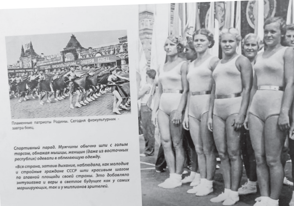
Пламенные патриоты Родины

Выставка «Лыжи из прошлого» организована областным Законодательным Собранием совместно с АНО «Алтарь Отечества» и региональной Федерацией лыжных гонок в рамках одноименного Нижегородского ретрофестиваля, включающего массовые забеги на деревянных лыжах, муниципальный конкурс для школьников, передвижную выставку коллекционных лыж и серию тематических фотовыставок на спортивную тему.