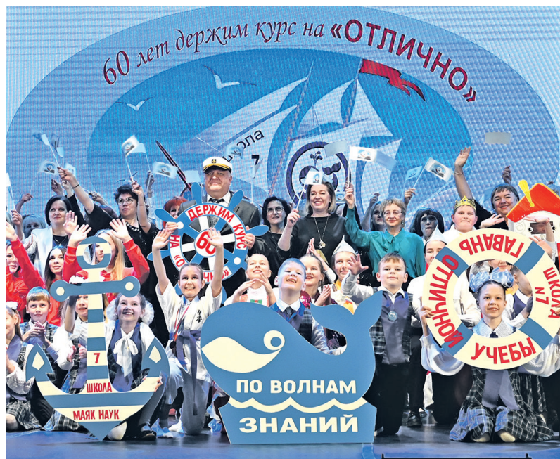
☐ Капитан корабля под названием «Школа № 7» (в центре – в фуражке) уверенно держит штурвал в своих руках!