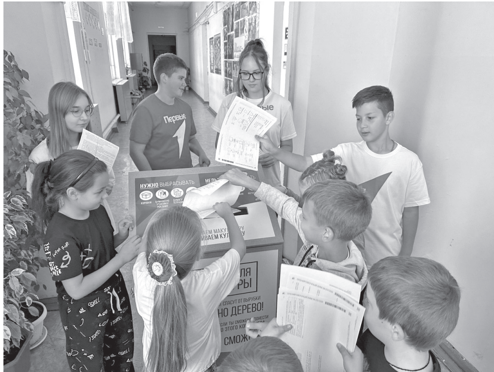
📷 Проект в действии