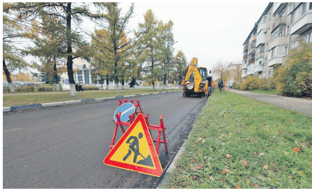
В городе большие планы по благоустройству

сипедной дорожки, детской игровой площадки с безопасным покрытием и ограждением, современным освещением и системой видеонаблюдения.