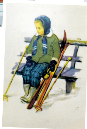
Открытка СССР «Маленькая лыжница», 1958 г.

Выставка «Лыжи из прошлого» организована областным Законодательным Собранием совместно с АНО «Алтарь Отечества» и региональной Федерацией лыжных гонок в рамках одноименного Нижегородского ретрофестиваля, включающего массовые забеги на деревянных лыжах, муниципальный конкурс для школьников, передвижную выставку коллекционных лыж и серию тематических фотовыставок на спортивную тему.