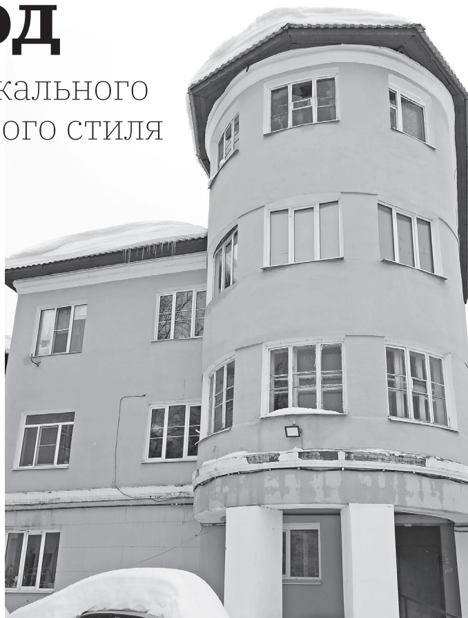
Башенки на ножках в переулке Учебном

А вот торговый центр «Дзержинец», возведенный в 2008 году на месте школы № 2, целиком и полностью построен в стилистике неоконструктивизма. Простейшие геометрические объемы (квадратики, скругленные углы, ленточное остекление фасадов) и бездекоративность. Строительные материалы – более современные, безусловно, о таких архитекторам прошлой эпохи можно было только мечтать. С постройкой «Дзержинца» южная и юго-восточная часть площади Дзержинского приобрела ярко выраженный конструктивистский угол – администрация, бывший ки-