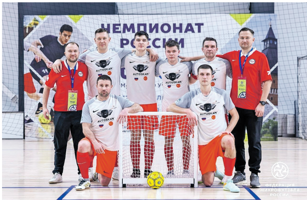
Команда «Администрация-First» заняла 5 место в чемпионате России

Клуб из Дзержинска вошёл в топ-5 лучших команд страны