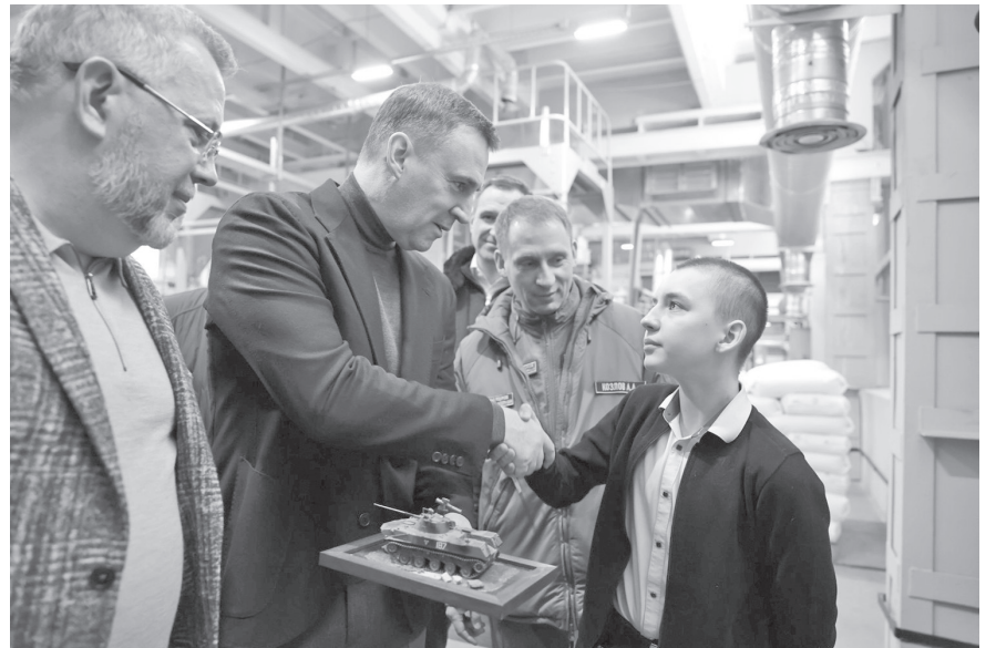
Дмитрий Патрушев знакомится с молодыми специалистами