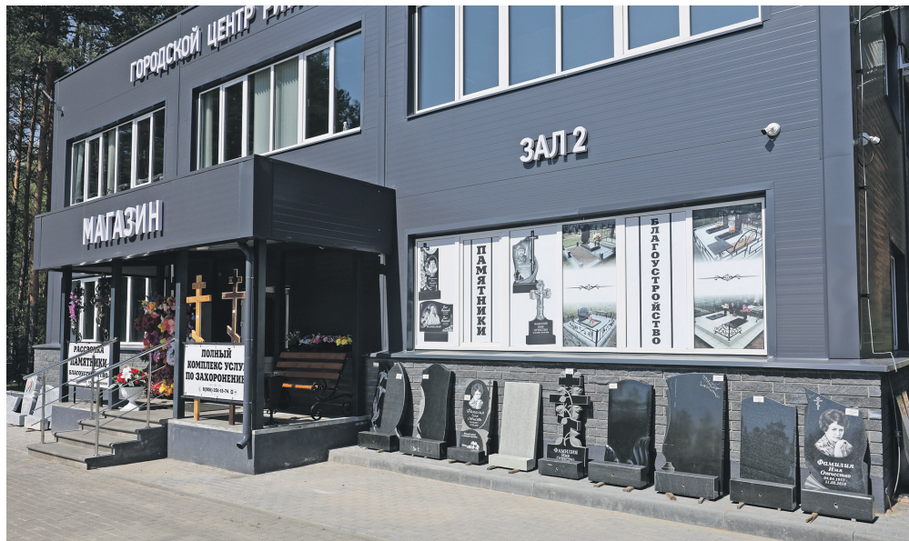
📍 Прощание с близкими организовано по адресу: пр. Свердлова, 33У

– Коррупцию в сфере похоронного бизнеса, по моему мнению, никогда не искоренить. Ритуаль-