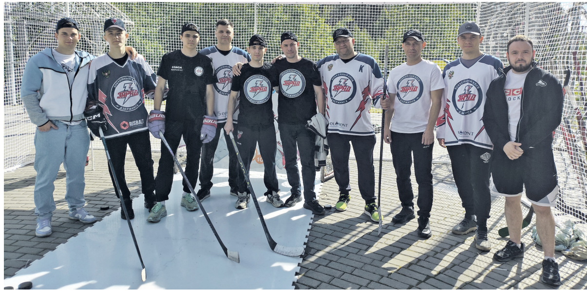
В хоккей играют настоящие мужчины

А любителям хоккея предлагалось... забить шайбу! Спортсмены из дзержинского хоккейного клуба «Заряд» на территории «Утинки» организовали бросковую зону с небольшой платформой из искусственного