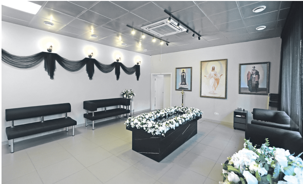
📍 Траурные залы отвечают всем современным требованиям

Мы с клиентом с самых первых минут, помогаем с оформлением документов, выбором принадлежностей, предоставлением услуг по транспортировке, обустройству и содержанию места захоронения. При этом мы заключаем договор и не