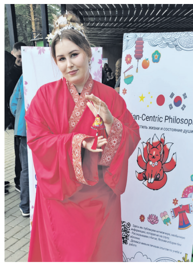
В Дзержинске все народы едины

льда, хоккейными воротами и настоящей экипировкой хоккеистов.