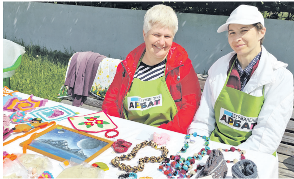
Клуб инвалидов «Вера» на «Дзержинском Арбате»