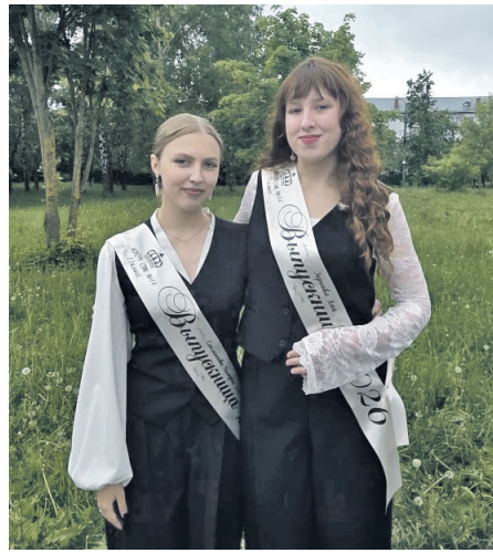
Выпускники школ - одни из участников праздника