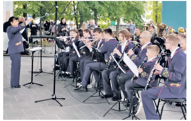
В городском саду играет духовой оркестр