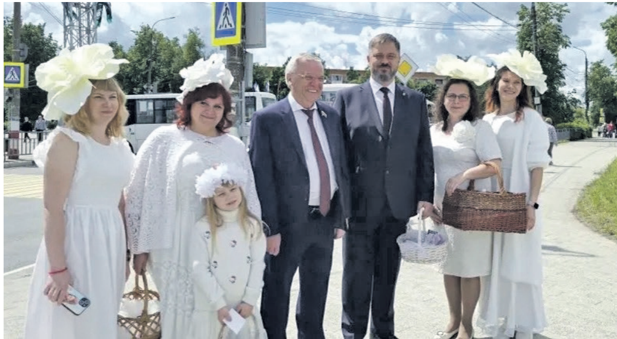
Акция «Белый цветок» направлена на благотворительность

30 мая в Дзержинске прошли праздничные торжества в честь Дня города