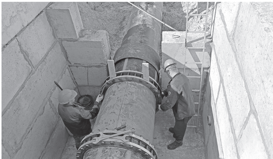
Работы на второй нитке Тепловского водозабора

О том, какие преимущества принесло это соглашение городу и его жителям спустя 15 лет, руководители АО «ДВК» рассказали на пресс-конференции.