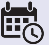
ГРАФИК РАБОТЫ ОФИСОВ ЦЕНТРА ПО РАБОТЕ С НАСЕЛЕНИЕМ