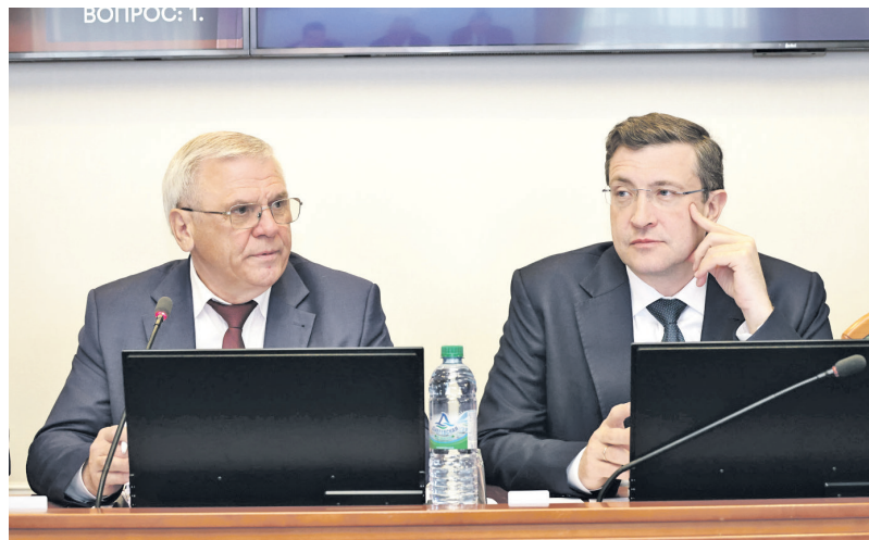
Евгений Люлин и Глеб Никитин в президиуме

Инициатива внесена губернатором Глебом Никитиным и поддержана депутатами. При подготовке документа ко второму чтению законопроект был дополнен еще одним направлением использования средств – на завершение строительства