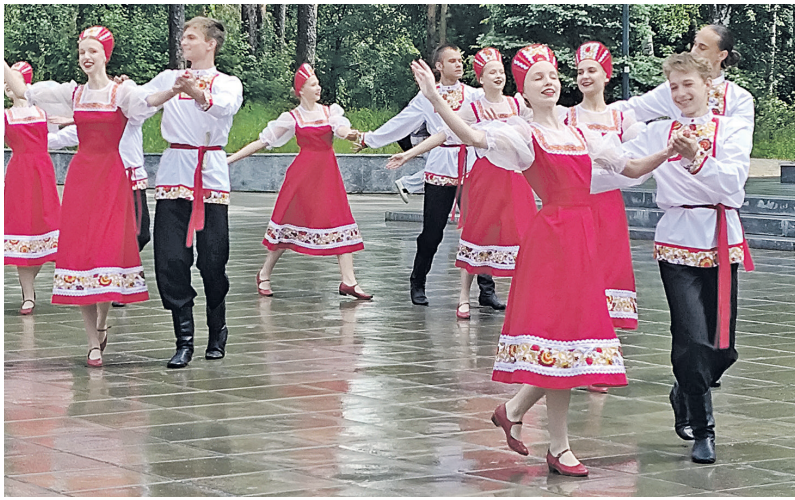
Закружили в русском хороводе